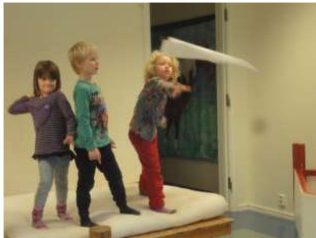
Har kasttekniken någon betydelse?

Har storleken på flygplanen någon betydelse? Vilket papper funkar bäst? Har det någon betydelse hur man kastar (kastteknik)?