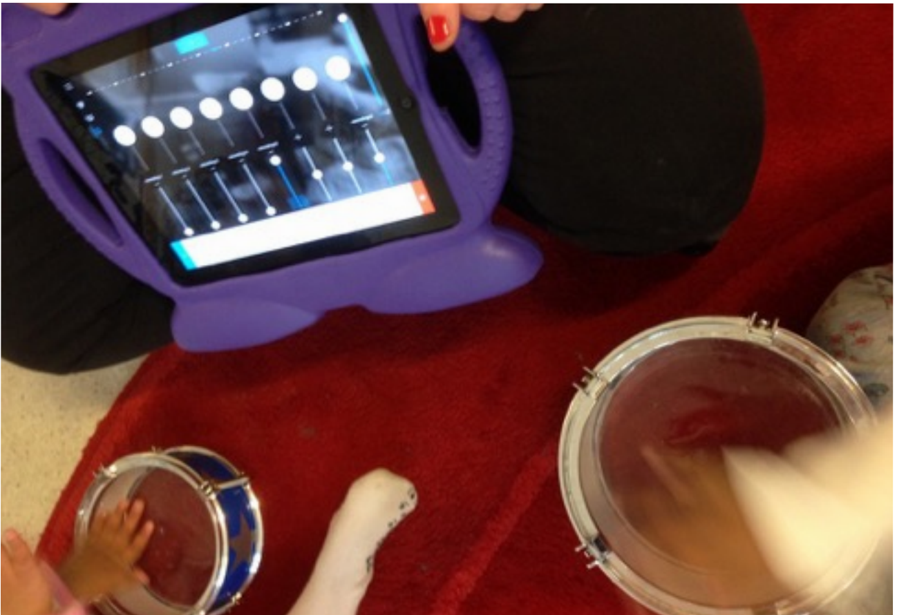
När blir ljud musik? Genom digitala verktyg