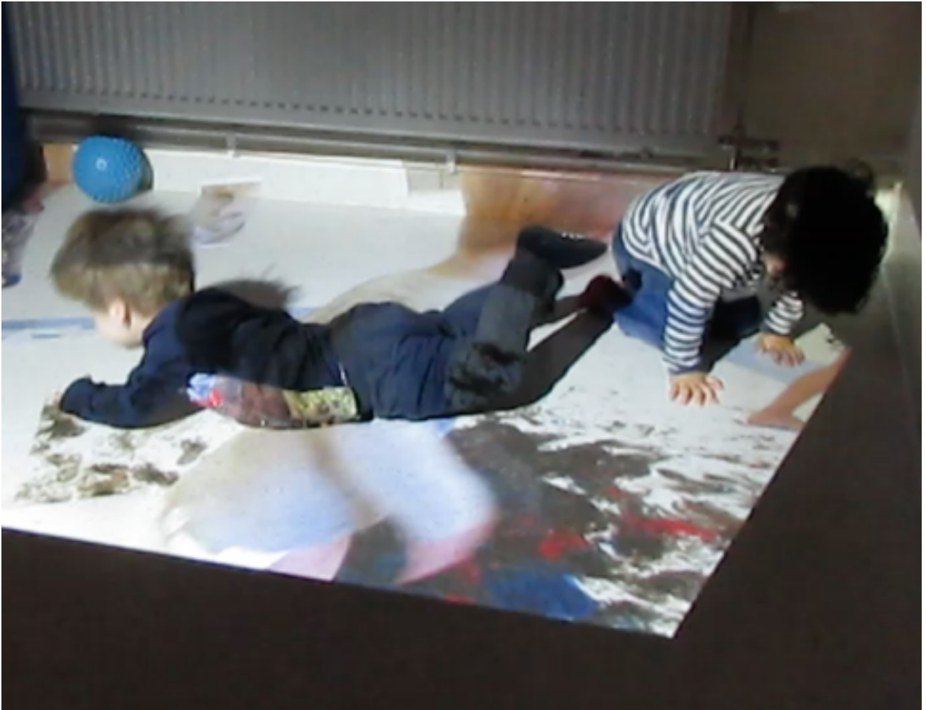
Reflektion genom projektorn