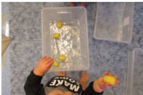
Kastar ljudägg i vattnet från hög höjd