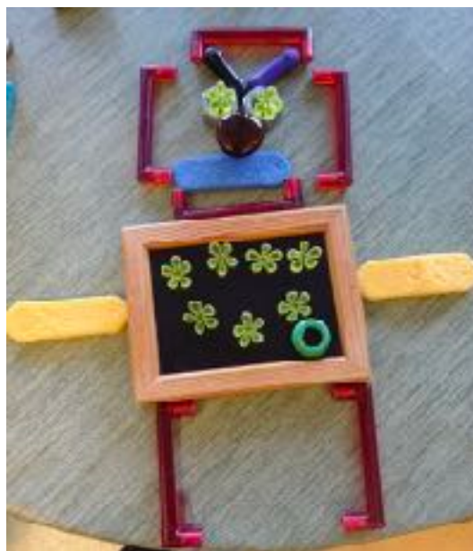
Fjäders "leksaker" inspirerar till fantasi och kreativitet

När vi pedagoger observerade barngruppen märkte vi att fantasin hela tiden var närvarande i barnens lek och vardag. Fantasin gav upphov till mycket glädje och nya kreativa tankar men vi upptäckte också att konflikter bland barnen ofta handlade om "vad som är rätt och fel" , vad som "finns på riktigt och vad som finns på låtsas" . Genom att låta digitala verktyg möta barnens verklighet och fantasi var vår förhoppning att inspirerande och lärorika samtal/utforskande skulle uppstå i både lek och arbete.